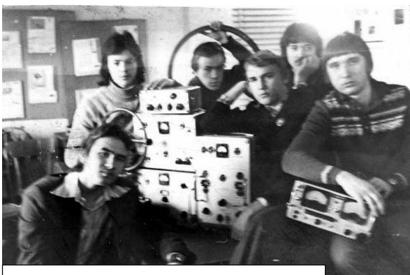
Будущие геофизики. Практические занятия с аппаратурой, 1979г.

А мы продолжаем печатать воспоминания студентов ИГРТ «Через годы, через расстояния...». На просторах интернета мы наткнулись на вот такие интересные воспоминания студентов 70-х о том, почему они выбрали специальности геолога, геофизика.